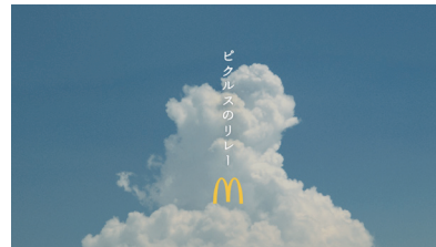
日本マクドナルド 来店促進 / 家族といっしょに。『ピクルスのリレー』篇

サントリーは黒木華、柳楽優弥出演の『金麦』、KDDIは松田翔太らが出演する『三太郎』シリーズなどを展開した『au』、満島ひかりと松田龍平が共演する『UQ』で多く得票。キリンビールは堤真一、満島ひかりら出演の『一番搾り』が引き続き好評だった。