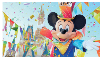
オリエンタルランド 東京ディズニーリゾート® 「ずっと、待ってた!」篇

楽天グループは自己最多の9276回の放送回数を記録。そのうち半数以上を占めた『楽天トラベル』のCMはももいろクローバーZのメンバーが旅行を楽しむ内容で、CM好感度を大きく牽